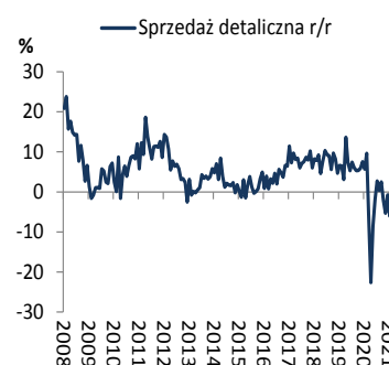
Wykres 2. Sprzedaż detaliczna (dynamika r/r)